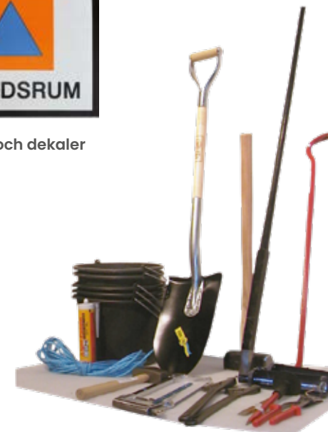
Grundutrustning enligt SR