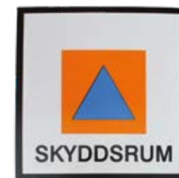
Skylltar och dekaler