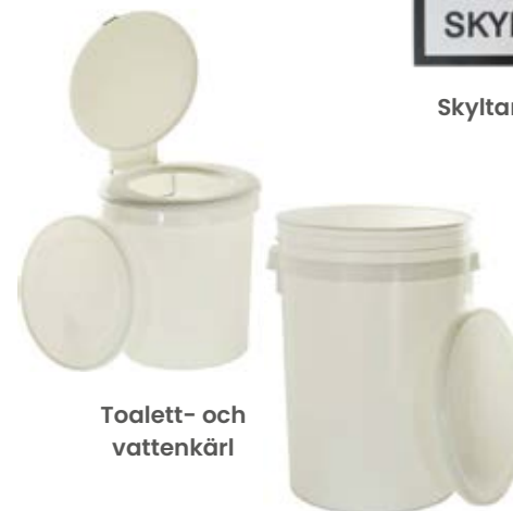
Toalett- och vattenkärll