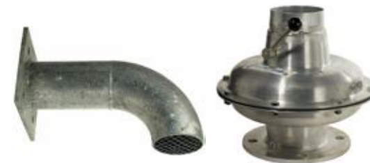
Uteluftkanal med stötvågsventil